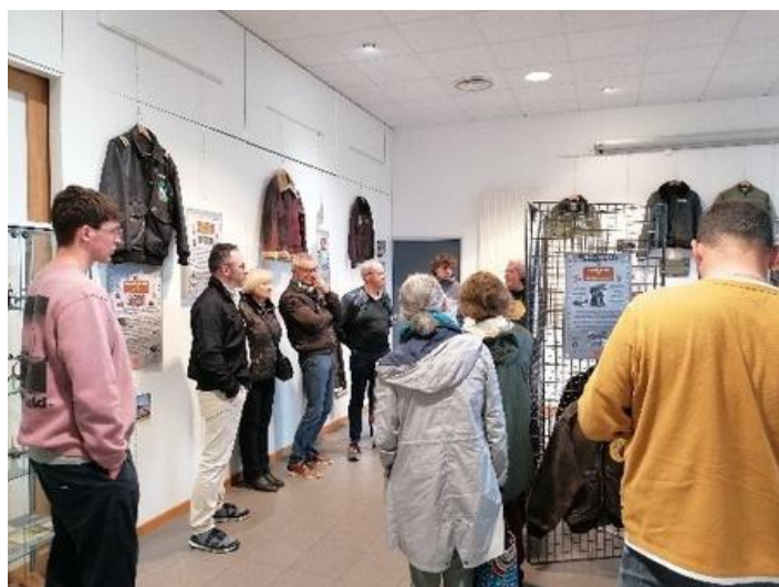
La visite guidée dans la médiathèque

La médiathèque accueillait l'exposition « Le cuir des anges », un mélange de l'exposition « Le cuir de nos libérateurs » et de « L'évolution des blousons de vol ». La visite guidée du 4 novembre nous faisait rencontrer des passionnés qui sont désormais des contacts fructueux.