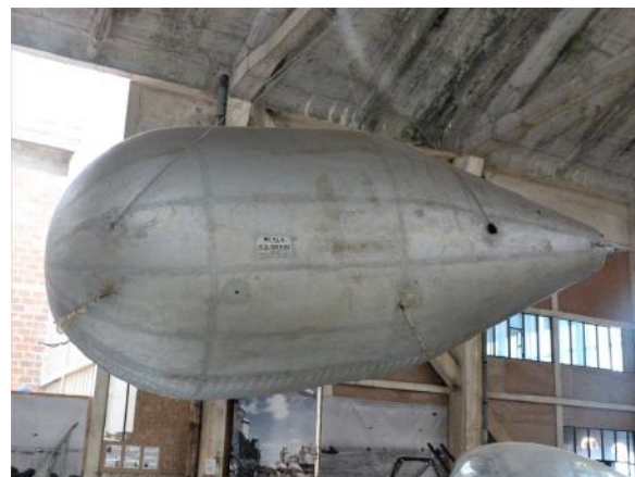
Ballon captif américain

Sitôt entré, en levant la tête un ballon captif américain attire le regard. Cet exemplaire singulier a la particularité d'être unique au monde, en effet il est le seul encore en état de vol. Il s'agit de l'un des trois derniers exemplaires survivants sur la planète. Le 6 juin 1944 le 320 th Air Barrage Balloon installe des ballons aux abords des plages du débarquement d'Utah beach et d'Omaha beach. L'unité a pour mission de mettre en place ces ballons de barrage remplis d'hydrogène pour protéger les troupes au sol de l'aviation ennemie.