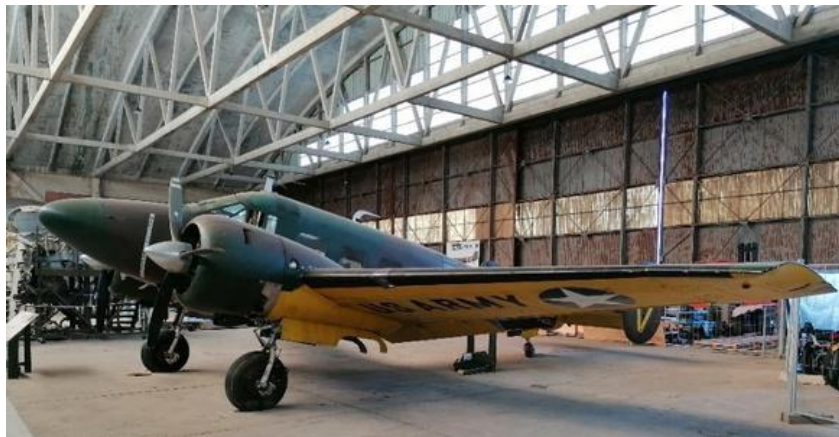
Beech 18

Tout au fond du hangar un « Beechcraft 18 » (ou C-45 en version militaire) qui a formé nombre de pilotes, copilotes, navigateurs et bombardiers aux Etats-Unis est en exposition. Ce véritable exemplaire a été construit après-guerre en 1958.