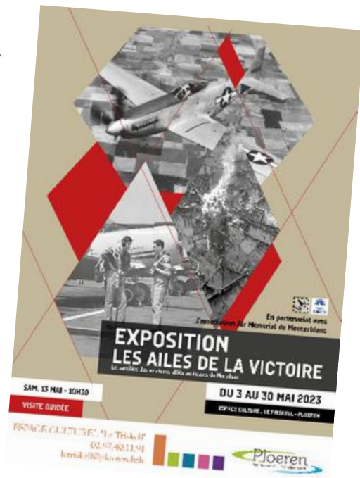
Affiche de l'exposition