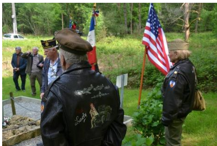
Les membres d'Air Memorial lors de la cérémonie

En ce mois de mai 2023, la famille Couture revenait avec leur petite fille pour lui expliquer ce drame et nous avons participé à une célébration en comité restreint avec le Souvenir Français.