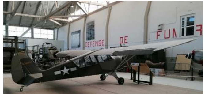
L'Aeronca Defender type L3 de 1941 / Photo : Air Mémorial.

Figure aussi dans la collection du musée un authentique avion de liaison, d'observation et de réglage de tirs de l'armée américaine « Aeronca Defender type L3 » de 1941. Ce type d'appareil moins connu car moins médiatisé que les avions de chasse ou les bombardiers de l'USAAF a néanmoins largement participé à la victoire finale.