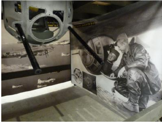
Tourelle ventrale de B-17

Il est également possible de prendre place dans le cockpit d'un avion de chasse Focke-Wulf 190. Bien qu'il s'agisse également d'une réplique, c'est un modèle Jurca à l'échelle \frac{3}{4} , l'effet est garanti ! Une fois redescendu sur terre, changeons de posture et installons-nous dans la tourelle ventrale d'une forteresse volante B-17. Une nouvelle expérience, rare, qui permet de prendre pleinement conscience de l'inconfort et de la dangerosité que présentait cette fonction pour les jeunes aviateurs américains.