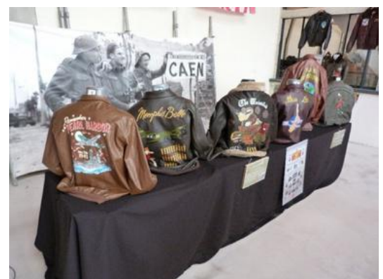
Exposition « Le Cuir des Anges au D-Day Wings Museum / Photo Air Mémorial.

A l'heure du bilan, début septembre, plus de 8 700 visiteurs ont découvert l'exposition « Le cuir des anges » avec de nombreux étrangers. Les éloges ont été nombreuses et nous encourageant pour une prochaine collaboration.