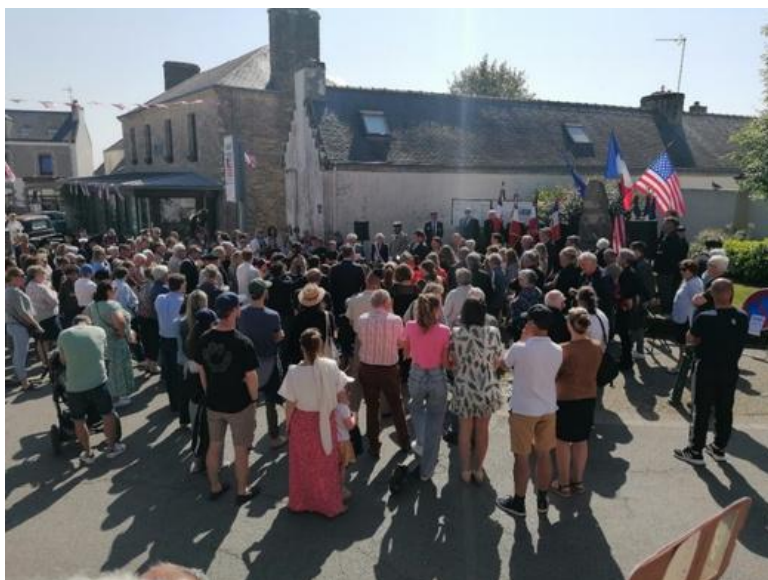
Samedi 27 mai 2023, la cérémonie à Crach