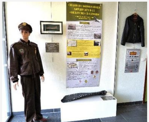
Le crash de Camors