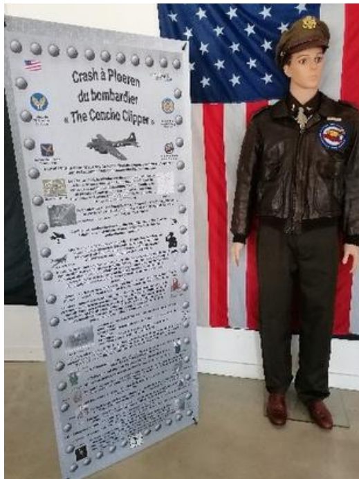
Panneau du crash de Ploeren

La municipalité de Ploeren, répondant à notre sollicitation, accueillait l'exposition « Les ailes de la victoire » le sacrifice des aviateurs alliés au-dessus du Morbihan durant la seconde guerre mondiale.