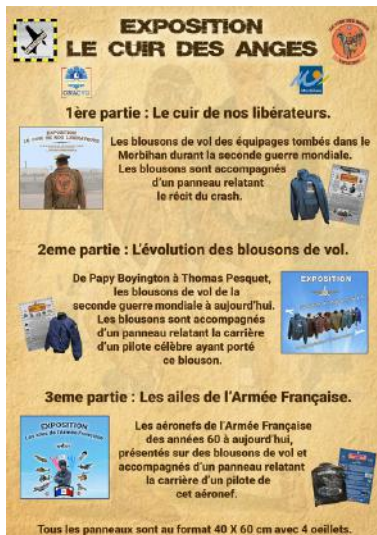
Flyer exposition "Le cuir des anges" / Création : Air Memorial

L'exposition "Le cuir des anges" sera présentée, avec ses trois parties, lors des Journées Européennes du Patrimoine les 21 et 22 septembre 2024 à Pluvigner, salle de la Madeleine.