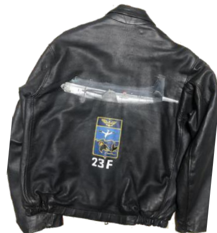
Trois blousons de la collection / Création : Fanny Canioni - Regnault

Si vous souhaitez voir d’autres de ses créations vous pouvez aller sur la page Facebook “Créations de Fanny La Fée Main”.