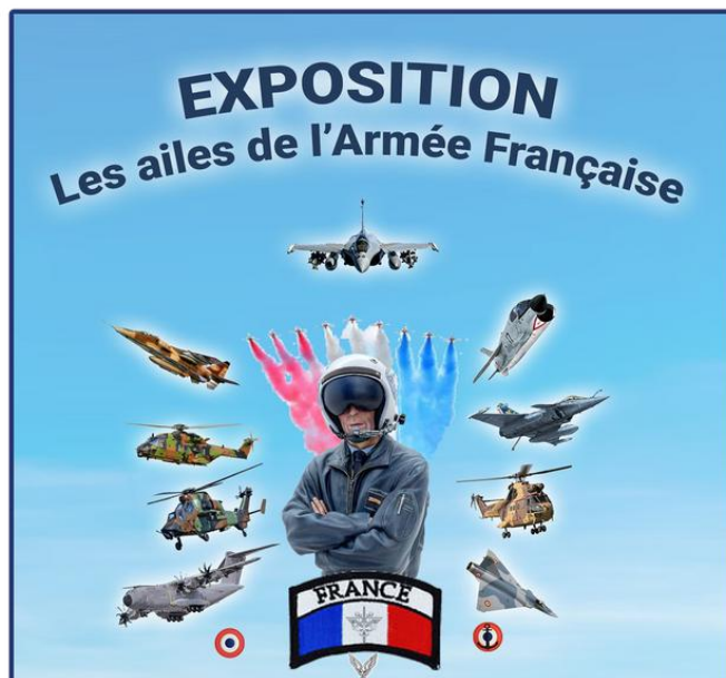
Visuel de l'exposition / Création : Air Memorial

Les trois armées sont représentées, l’Armée de l’Air, l’Aéronautique Navale, l’Aviation Légère de l’Armée de Terre et modestement la Gendarmerie et la Sécurité Civile.