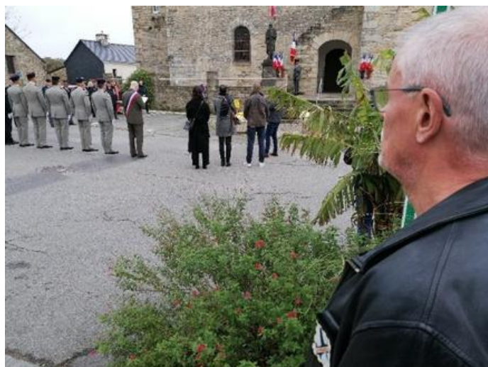
La cérémonie