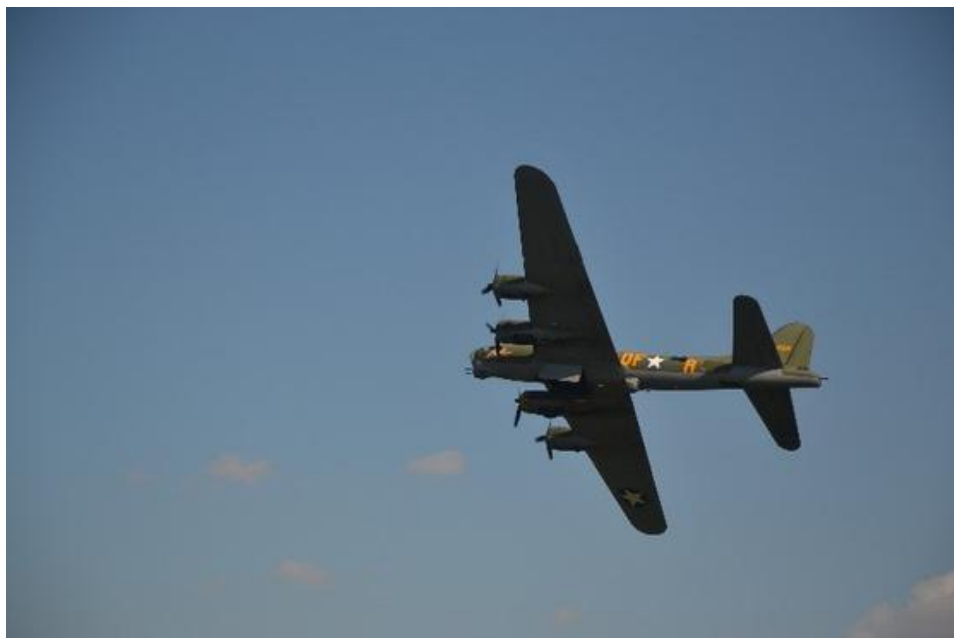
Le B-17 Sally B en vol à Melun