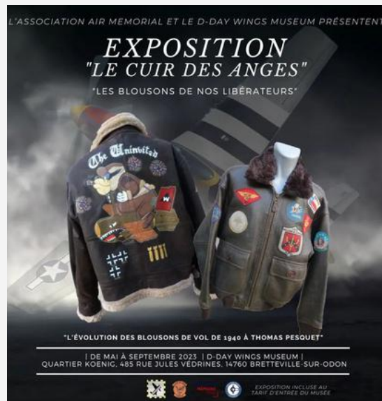
Affiche exposition "Le cuir des anges" / Photo : D-Day Wings Museum