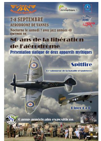
Affiche manifestation MAM / Création : Morbihan Aéro Musée

L'exposition "Le cuir de nos libérateurs" sera présentée sur l'aérodrome de Vannes / Monterblanc les 7 et 8 septembre 2024 à l'occasion de l'évènement organisé par l'association Morbihan Aéro Musée.