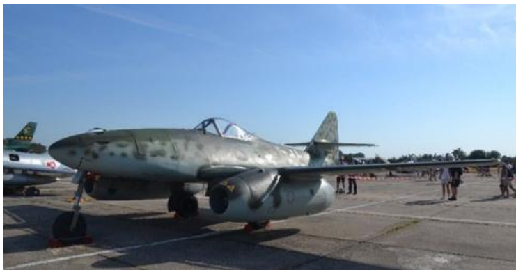
Le Me 262 A-1c de la Fondation Messerschmitt à Melun